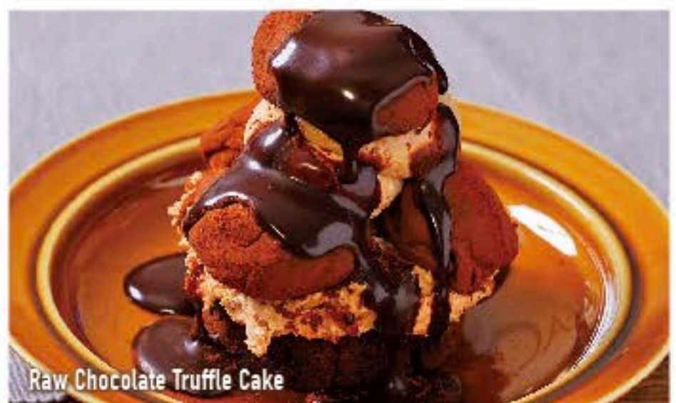
Raw Chocolate Truffle Cake