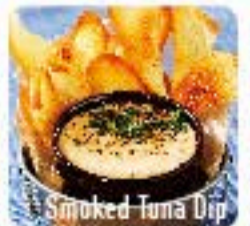
Smoked Tuna Dip