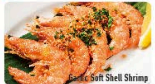
Garlic Soft Shell Shrimp