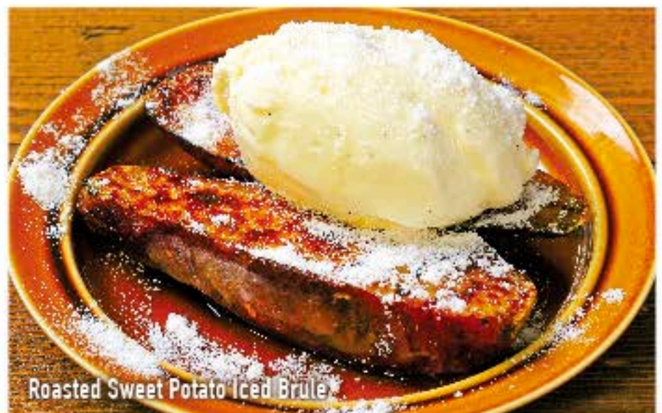
Roasted Sweet Potato Iced Brulee